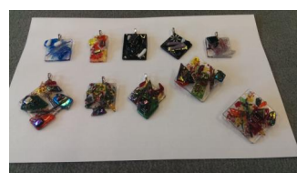
Glashangers en broches