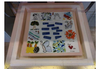
Het werkstuk in de oven