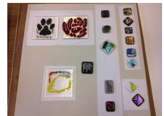
Eigen creaties (onderzetters en hangers)