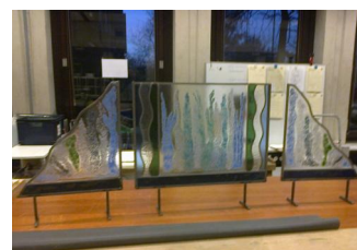
Raamdecoratie met frit (kleine glasstukjes) glas-in-lood afwerking door het glasatelier