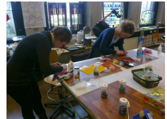
Aan het werk