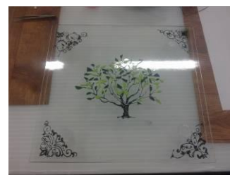
Glasmozaïek combinatie met glasverf