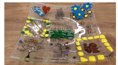
Schaal met 9 of maximaal 16 stukken