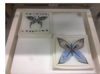
Beschilderen met glasverf