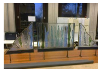
Raamdecoratie met frit (kleine glasstukjes) glas-in-lood afwerking door het glasatelier