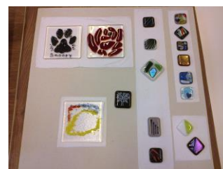
Eigen creaties (onderzettaars en hangers)