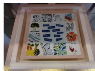
Het werkstuk in de oven