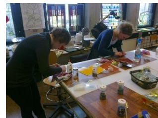
Aan het werk