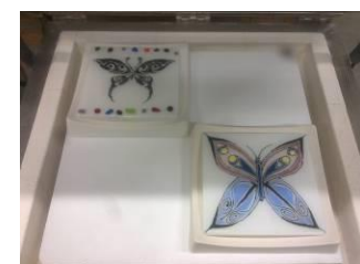
Beschilderen met glasverf