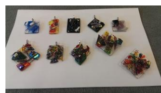
Glashangers en broches