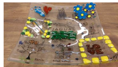
Schaal met 9 of maximaal 16 stukken