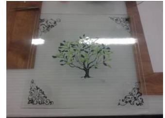
Glasmozaïek combinatie met glasverf