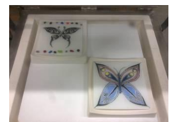
Beschilderen met glasverf