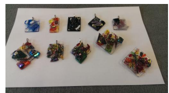
Glashangers en broches