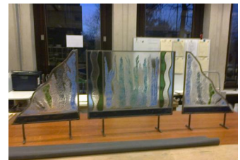
Raamdecoratie met frit (kleine glasstukjes) glas-in-lood afwerking door het glasatelier